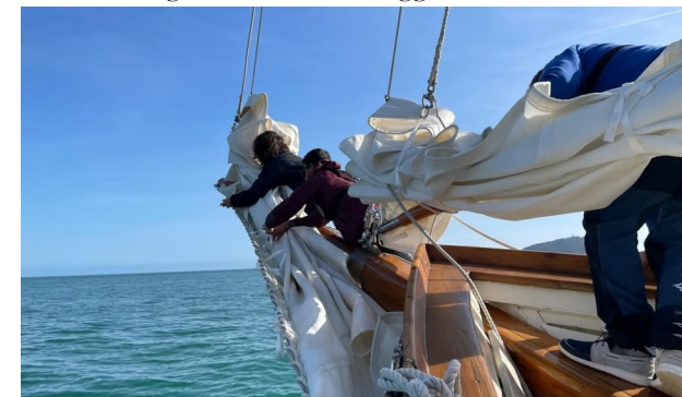
Buon vento a tutti noi!